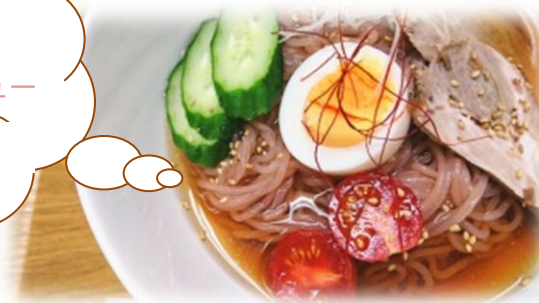
・赤〜いりんご冷麺・・・¥680