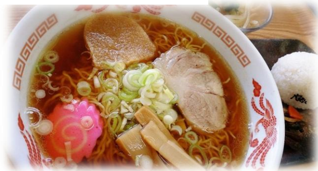
中華そばセット・・・¥750