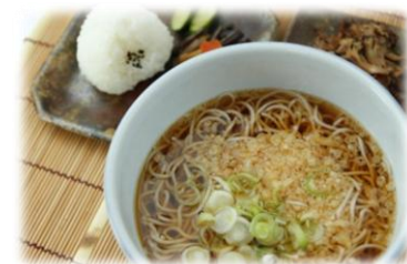
ぼんじゅそばセット・・・¥650