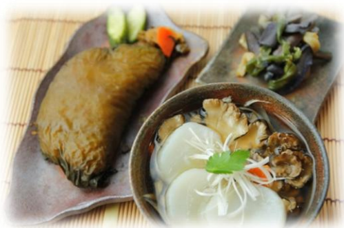
若生おにぎりセット ¥650